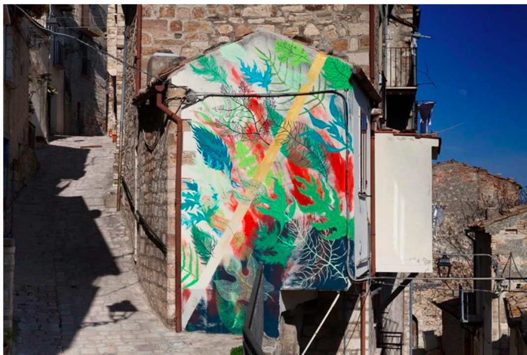
Gola Hundun per Cvtà Street Festival