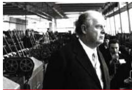
Etica, bellezza e creatività