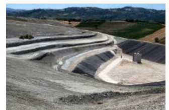
Diatrube in discarica