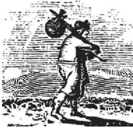
Antica illustrazione della gluppa

Anticamente utilizzato nelle campagne marchigiane per portare effetti personali o il pranzo, la gluppa, era un fazzoletto annodato alle quattro estremità, pratica, leggero e lavabile, un elemento della tradizione che viene rielaborato per questo progetto da Moneyless, un'artista di fama internazionale in collaborazione con l' Antica Stamperia di Emanuele Francioni a Carpegna , punta d'eccellenza dell'artigianato locale made in Marche. La gluppa, seppur destinata a una funzione specifica, nasce come oggetto artistico dalla fusione tra arte e artigianato, diventando l'involucro esterno che contiene una selezione di prodotti di aziende marchigiane. La gluppa quindi racchiude le Marche, l'arte e i suoi sapori.