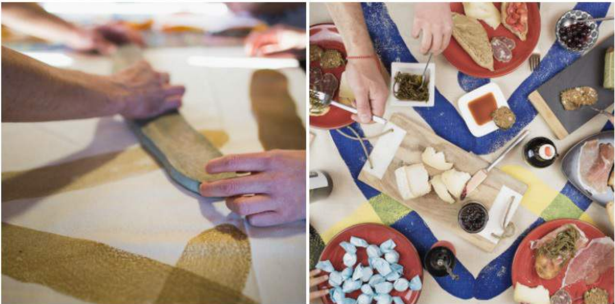
La gluppa ideata da Moneyless e i prodotti marchigiani selezionati

Anticamente utilizzato nelle campagne marchigiane per portare effetti personali o il pranzo, la gluppa, era un fazzoletto annodato alle quattro estremità, pratica, leggero e lavabile, un elemento della tradizione che viene rielaborato per questo progetto da Moneyless, un'artista di fama internazionale in collaborazione con l' Antica Stamperia di Emanuele Francioni a Carpegna , punta d'eccellenza dell'artigianato locale made in Marche. La gluppa, seppur destinata a una funzione specifica, nasce come oggetto artistico dalla fusione tra arte e artigianato, diventando l'involucro esterno che contiene una selezione di prodotti di aziende marchigiane. La gluppa quindi racchiude le Marche, l'arte e i suoi sapori.